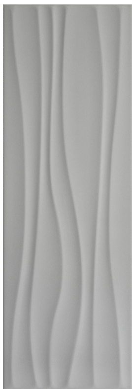
GRIS PERLE 20x60 cm (8" x 24") Épaisseur nominale : 9.5 mm 3D Vague; Fini mat QT.LG.DGY.0824.WV