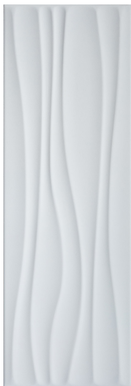
BLANC ARCTIQUE 20x60 cm (8" x 24") Épaisseur nominale : 9.5 mm 3D Vague; Fini mat QT.LG.ARW.0824.WV