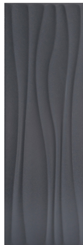
GRIS FONCÉ 20x60 cm (8" x 24") Épaisseur nominale : 9.5 mm 3D Vague; Fini mat QT.LG.DGR.0824.WV

Tous les items présentés dans ce document font partie du programme d'inventaire Olympia. Pour les commandes spéciales, veuillez contacter votre représentant de Tuiles Olympia.